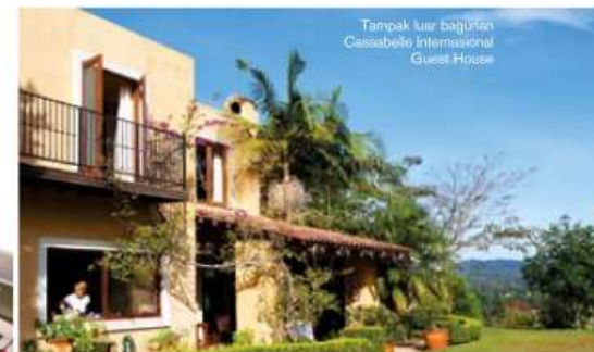
Tampak luar bangunan Cassabelle Internasional Guest House