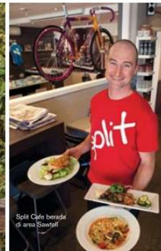
Split Cafe berada di area Sawtell