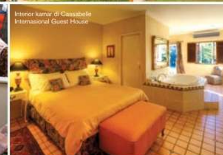
Interior kamar di Cassabelle Internasional Guest House

Sawtell. Untuk lebih mengenal alam, Time Out X'perience memberikan adventure experience dengan mengendarai semacam skuter bernama segway sambil mengelilingi area Novotel. Keesokan harinya, kami diajak berkunjung ke Dorrigo Rain Forrest dan Butter Factory. Bangunan yang dulunya pabrik mentega ini sekarang menjadi kafe, art gallery , fashion store , dan leather goods . Salah satu restoran paling terkenal di tempat itu adalah Ave Restaurant, sebuah bekas bangunan gereja tua yang sudah direnovasi.