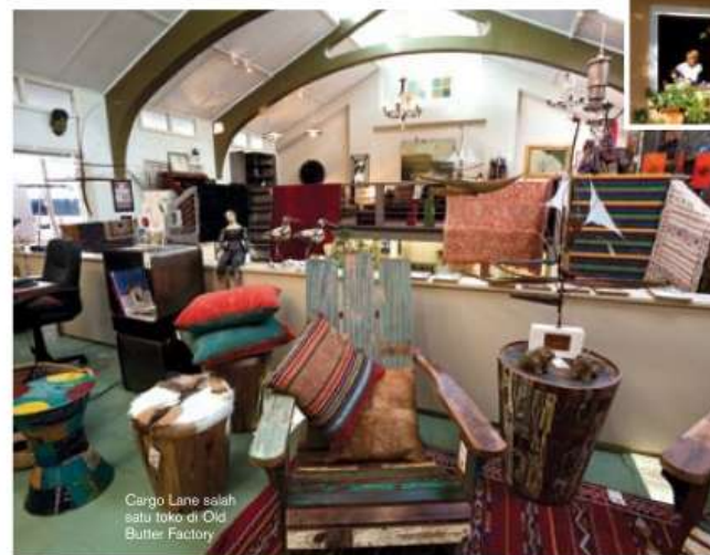
Cargo Lane salah satu toko di Old Butter Factory